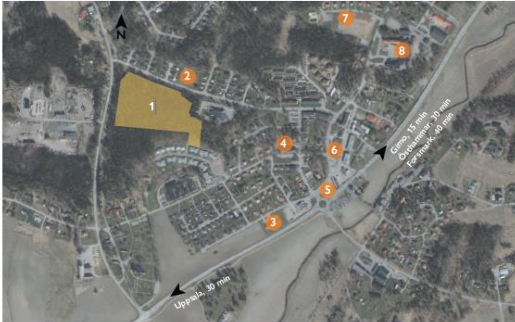
1. Prästgårdshöjden 2. Lekplats 3. Vårdcentral 4. Förskola 5. Bussterminal 6. Mataffär & apotek 7. Idrottsanläggning 8. Skola