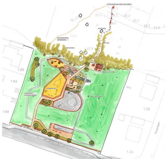
Bilden visar en tidig skiss av Torpvägens lekplats i Alunda.

Uppdatering av lekplats - Lekplatsen på Torpvägen i Alunda får en rejäl upplyftning under 2024 och 2025. Lekplatsen byggs ut till en generationspark och får nya inslag som hämtar inspiration från platsens historia. Temat folksagor och folkdans går som en röd tråd i lekparken.