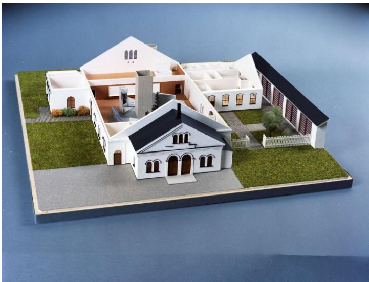
Modell av Ånghammaren. En event- och mässhall för bland annat konstutställningar, musikevent och mässor i Österbybruks historiska miljö.

Projektet har två delar – dels uppdatering och upprustning av byggnaden i del A och projektledning för att utveckla verksamheten med arrangemang i del B. Målet efter genomförd insats är att Ånghammaren fungerar som en flexibel upplevelsehall där kultur- och mässevenemang samsas och skapar förutsättningar för ett attraktivt fritidsliv. Platsen Österbybruk-Dannemora är ett stort utflyktsmål med aktiviteter för ett brett spektra av målgrupper.