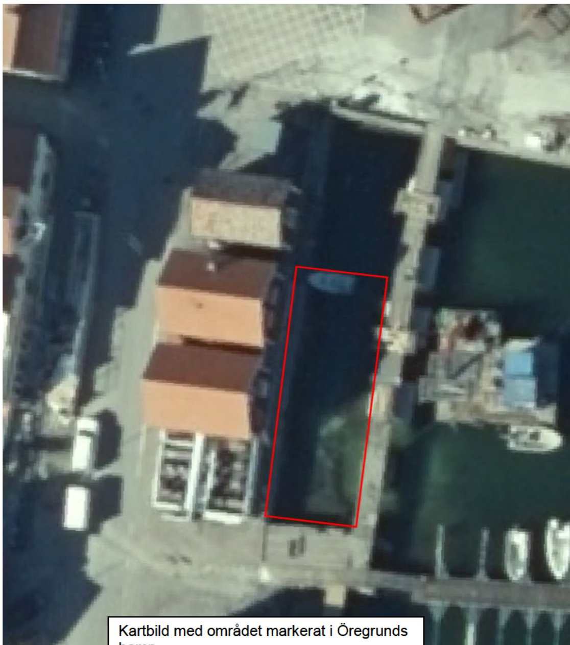
Kartbild med området markerat i Öregrunds hamn