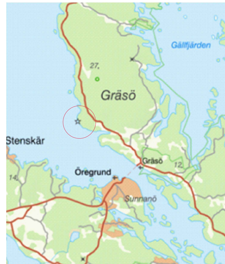
Översiktskarta med planområdet markerat inom röd cirkel.