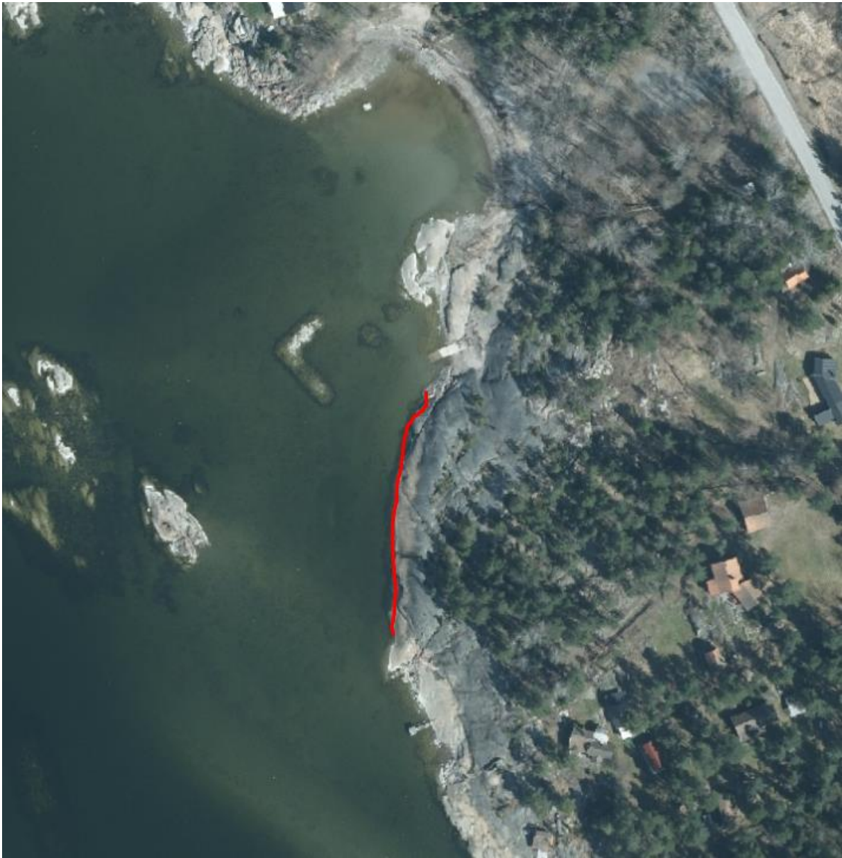
Figur 6: Översikt över området. Röd markering visar var klipporna är brantare och svårare att bada ifrån.

Direkt söder om den röda markeringen (Figur 6 & 7) finns badvänligare klippor med en befintlig brygga (Figur 4). Den befintliga bryggan nås genom en kort promenad och befinner sig ungefär 170 meter söderut från sandstranden som är placerad direkt norr om planområdet och ungefär 110 meter från båtisättningsplatsen.