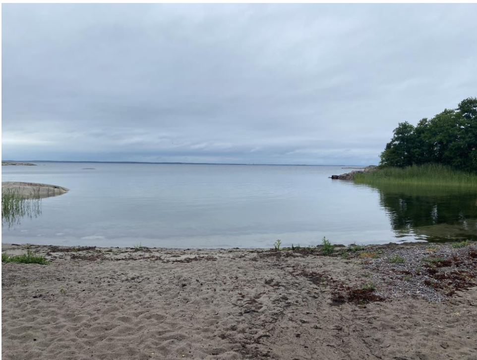
Figur 3: Sandstranden.