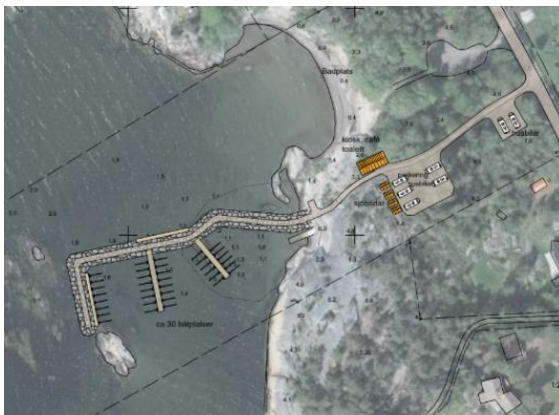
Figur 1: illustration av hur det kan komma att se ut.

Genom en etablering av småbåtshamn i planområdet minskar möjligheten för allmänheten till att bada från klipporna där. Däremot finns det fortsatta badmöjligheter vid sandstranden norr om den planerade småbåtshamnen och vid klipporna söderut. Nedan följer ett resonemang om hur det ser ut.