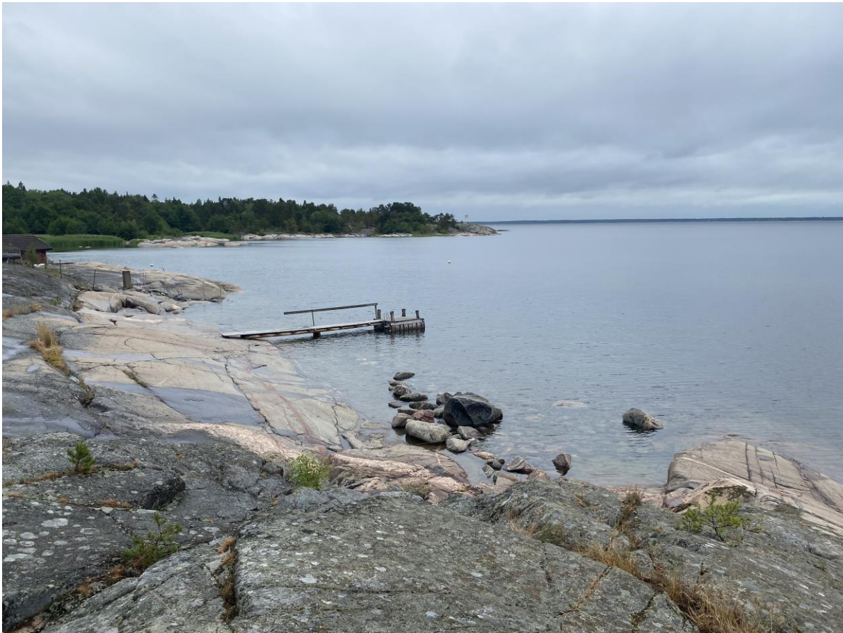
Figur 4: Klippor söderut nära planområdet.

Delar av klipporna är brantare men i närheten finns det även klippor där vattnet är mer lättillgängliga (Figur 4).