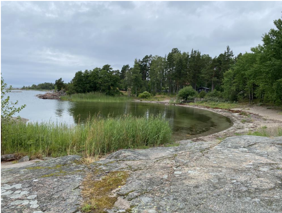
Figur 2: Sandstranden.