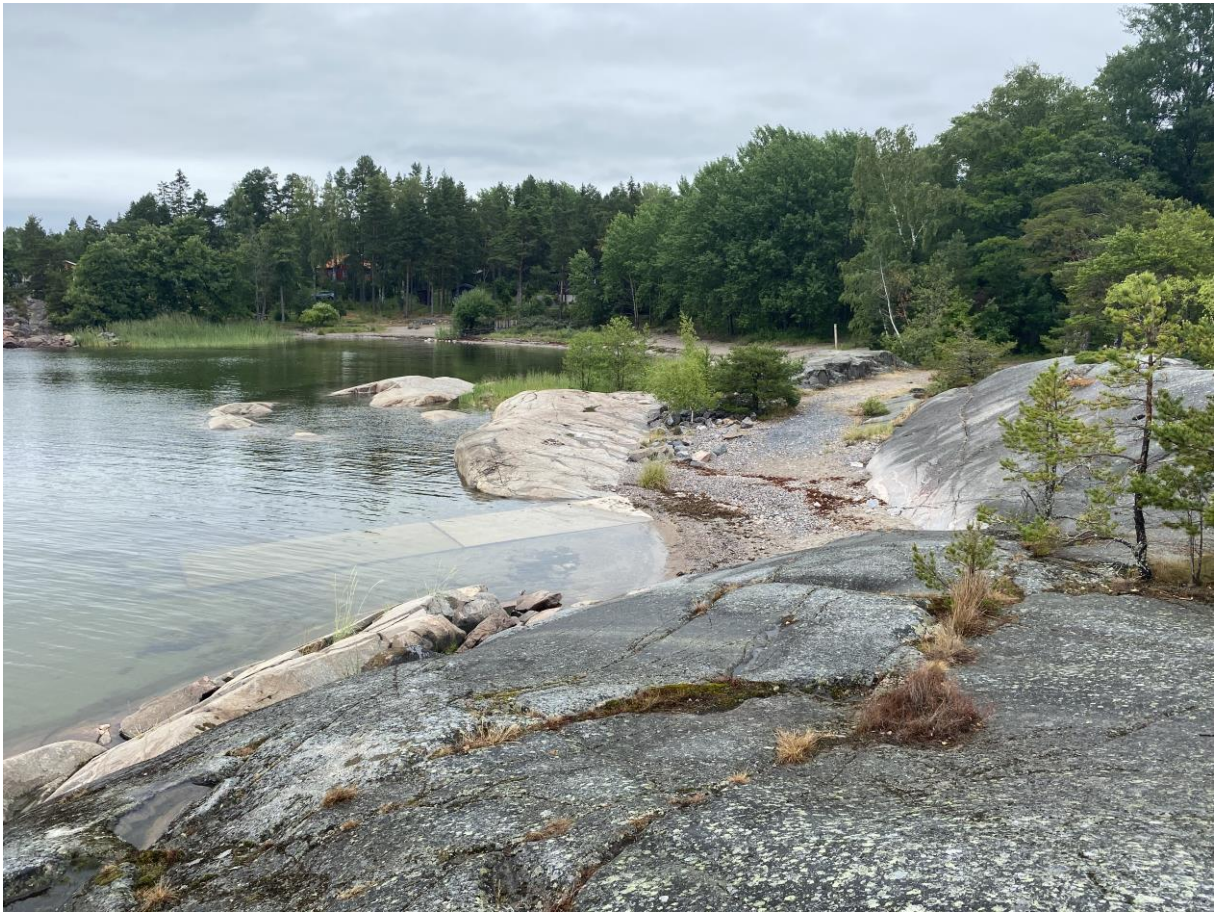
Figur 5: Vy över klipporna där småbåtshamnen är tänkt och båtsettningsplatsen.