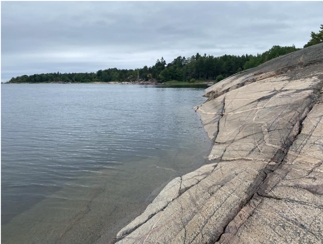
Figur 7: Några delar av klipporna är brantare.